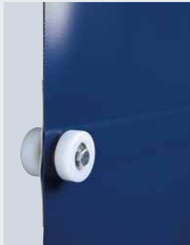
V 10008 Perde stabilitesi sağlayan yay çeliği rüzgar emniyeti