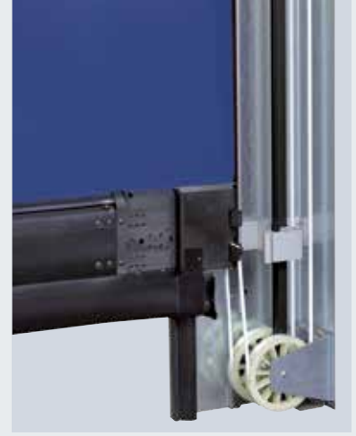
V 6030 SEL Güvenilir bir kapı hareketi için gergi mekanizması