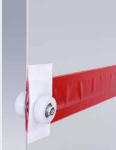
V 6020 TRL Daha fazla ışık ve görüş alanı için şeffaflık