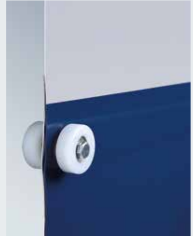
V 6020 TRL Opsiyonel pencereci perde (penceresiz olarak da temin edilebilir)