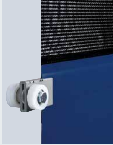
V 6030 SEL Opsiyonel sineklikli, perde stabilitesi sağlayan yay çeliği rüzgar emniyeti // YENİ

Bu model büyük açıklıklar yüksek rüzgar yükleri için özel olarak geliştirilmiştir. Çift gergi kayışları, yan çift makaralar, geniş hareket rayları yüksek perde ağırlığına rağmen güvenli kapı hareketi sağlar. Yay çeliği rüzgar emniyetleri 100 km/h hıza varan rüzgar yüklerine dayanım sunar.