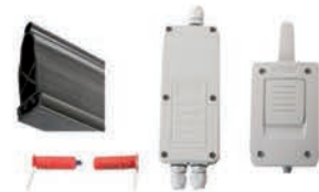
Alıcılı emniyet kiti