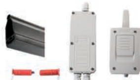
Alıcılı emniyet kiti lastiği h 58